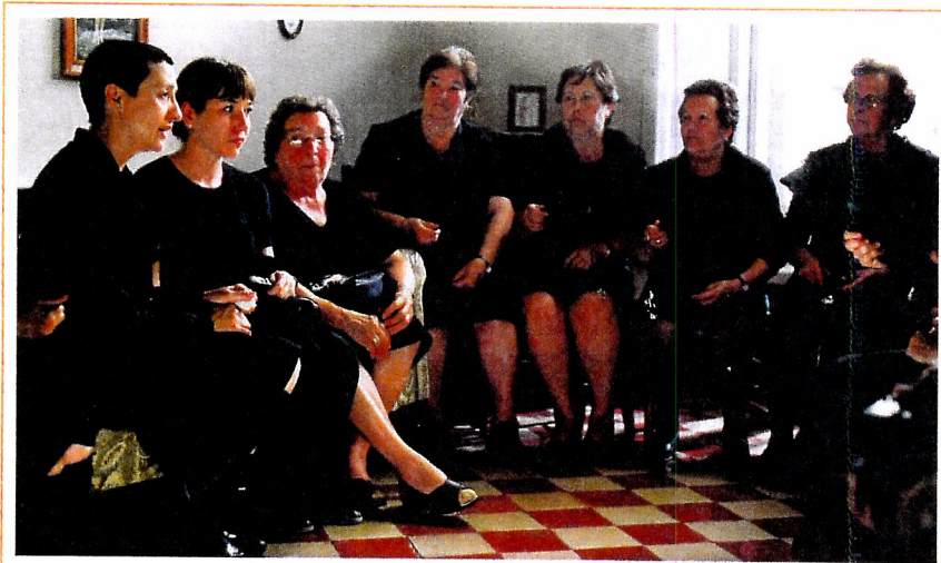
▲ Las mujeres del pueblo, vestidas de negro de pies a cabeza celebran el velatorio de tía Paula con oraciones y cotilleos (fotograma de la película)

If death in the fictional Manchegan village of Alcanfor de las Infantas is linked to tradition, ritual and the supernatural, then death in Madrid is disconcertingly real and matter-of-fact. In the village during the wake, Agustina discusses regular sightings of Irene's ghost with no hint of scepticism; death is merely a journey into the afterlife. In Madrid, faced with Paco's corpse, Raimunda quickly mops the floor of his blood, washes the murder weapon and dumps the body in the restaurant freezer. Death in the city is depersonalised, prosaic and an end in itself. To further emphasise this point, the whole episode is quickly expunged from memory when a business opportunity comes Raimunda's way in the form of Emilio's restaurant. Paula even reproaches her mother for not having buried the body weeks after the death.