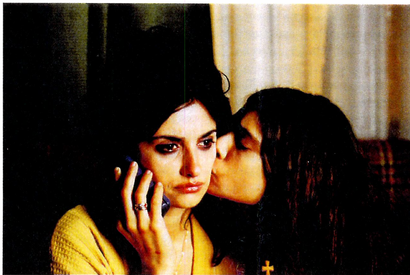
▲ Raimunda se inventa una excusa para no ir al funeral de la tía Paula (fotograma de la película)

to herself and letting Agustina die peacefully. Both Raimunda and her mother also keep another tragic secret: that Paula was conceived following the rape of Raimunda by her father. Even Sole, perhaps a less complex character, keeps her hairdressing business secret from the authorities, and does not initially tell Raimunda that their mother has returned. At one point, conversation between Sole and Raimunda becomes almost farcical as the former speaks about their mother as the Russian lady who is helping out as a hairdressing assistant, and the latter mentions that her deceased partner has left her following a heated argument, but is returning to perhaps try and patch things up. It is most striking that despite all this deceit and complexity, the characters generally appear positive, in control and their bonds strong.