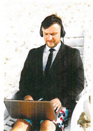
Casque sur les oreilles, ordinateur ouvert sur les genoux... un banal voyageur

Une pensée étrange traverse alors votre esprit : mais comment faisaient nos grands parents sans technologie ?