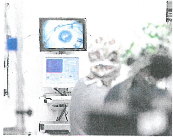
Microchirurgie en salle d'opération