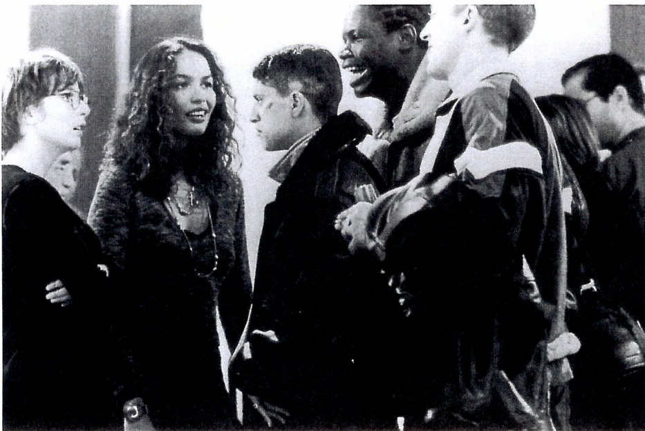
▲ Tension at the art gallery